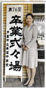
精道中学校 卒業式

◆3月議会トピック◆ ◆米寿(88歳)と百寿(100歳)の敬老祝金の廃止◆ 厳しい財政状況と高齢化の進展による支給額の増加が見込まれるため、新年度より廃止されます。 ◆ネーミングライツパートナー決定により、名称が変わります(4/1より)◆ 芦屋市立体育館・青少年センター↓シンコースポーツ体育館・青少年センター 川西運動場↓シンコースポーツグラウンド ◆災害時の廃棄物処理に関する協定を締結◆ 連携して円滑に対処できるように、市と大栄環境株式会社(神戸市東灘区)の間で結ばれました。