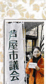
能登半島 地震支援募金