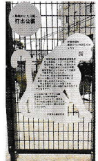
お猿の檻の モニュメント

図書館打出分室には、自動貸出機や図書の消毒機が設置されました。この自動貸出機は、平成28年12月議会で要望したものです。