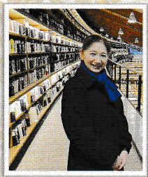
佐賀県武雄市へ会派 視察「ICT教育」 武雄市図書館も見学