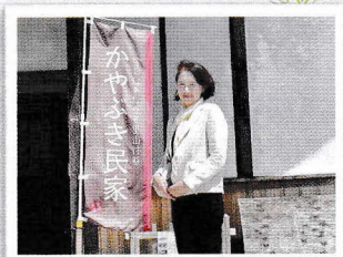
〈議員研修会〉尼崎に移築された旧小阪家住宅を視察