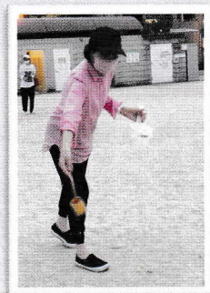
「市内あちこち打ち水大作戦」 @大榎公園に参加

〈お詫び〉前回、市政報告書Vol.45夏号の中で、指定ごみ袋の導入についてお知らせしましたが、タイトルの部分に誤字がありましたのでお詫び申し上げます。