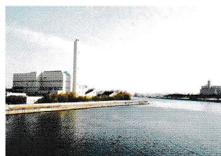
両市の環境センター

水道事業など今後様々な広域化問題においてこの経験を活かした協議を進め、実現されるよう要望してまいります。