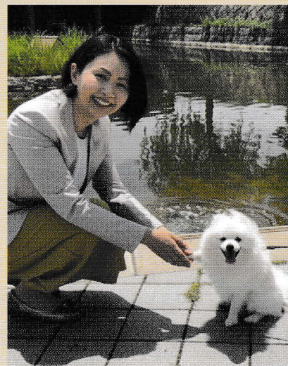
令和2年6月9日の建設公営企業常任委員会に初登場した時の録画です⇒

昨年より配属の総務常任委員会から、 建設公営企業常任委員会 へ令和2年度6月9日より配属が変わりました。主に、芦屋市のまちづくりに影響を及ぼす建設などの大事な事業内容を協議していく委員会です。また、都市計画審議会の委員に配属されました。これから審議会では、「芦屋市都市計画マスタープラン」の改正が予定されており、その内容についての話し合いが行われます。市で策定される最上位の計画である、「第5次芦屋市総合計画(策定中)」とも整合性を図らなければなりません。これらの計画は、令和3年度以降の本市のまちづくりの指針となる新しい総合計画となっていく、総合的な芦屋のまちづくりの指針を決める重要な策定ですので、市民の皆さまのご意見を市政に反映する議論を心がけながら、役目をしっかり果たしてまいります。